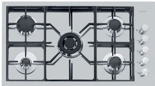
Table de cuisson S4000