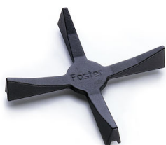
Support de Wok en fonte